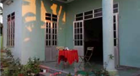
Sonnenaufgang mit Ca phé sua

Im Oktober konnten wir die Feier noch nicht durchführen weil die Eltern 2 Monate nach Amerika gereist sind und wir ihr Haus gehütet hatten. Danach durften wir uns in unserem neuen Zuhause erst einmal ein wenig einrichten und von dem langen Jahr mit vielen temporären Wohnorten etwas erholen. Doch nun ist die Wellnesszeit vorbei. Ein neues Kapitel beginnt.