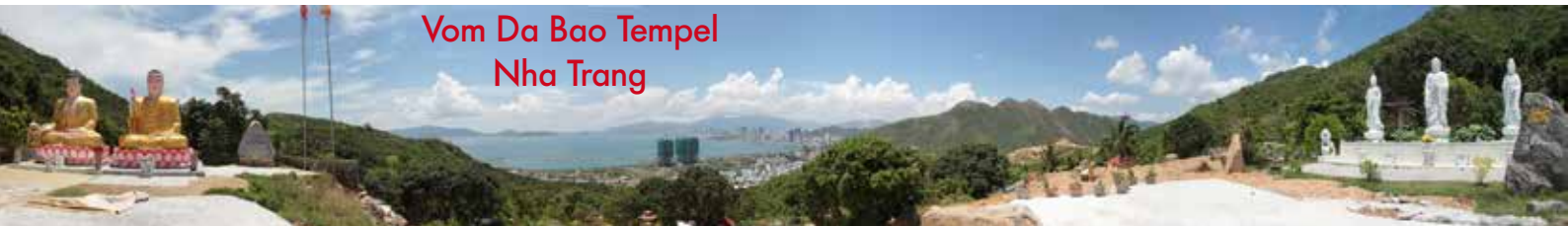
Vom Da Bao Tempel Nha Trang

Für alle die nicht kommen können gibt es ein kleines Trostpflaster. Wir werden so gut es mir und dem Team möglich ist auf Facebook Livestreams schalten. Zeitdifferenz 5 Std. Nachträglich werden wir mit Fotos unseren Tag dokumentieren und auch auf Facebook posten. Zudem gibt es die Möglichkeit anschliessend ein Fotobuch das ich von hier aus machen in der Schweiz zu bestellen. Und auch das nächste Pdf in diesem Stil wird nochmals ein paar Eindrücke wiedergeben.