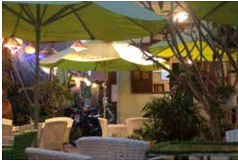
Café Lam Ha

Ein paar Dinge sind also geklärt und schon fast erledigt. Der Rest der Pendenzen muss sich in den kommenden 4 Wochen erledigen. No Problem, không sao/ chaoum sau würden die Vietnamesen sagen. Tù tù / toue toue = langsam.