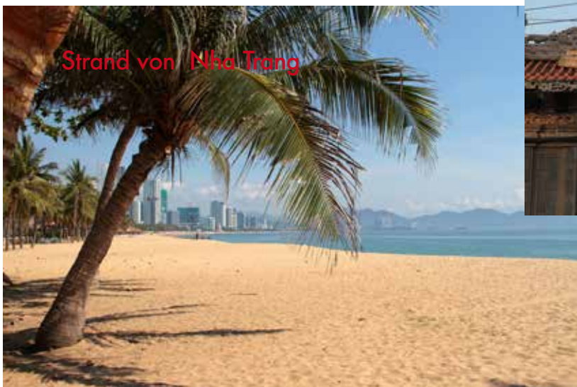
Strand von Nha Trang

Für alle die nicht kommen können gibt es ein kleines Trostpflaster. Wir werden so gut es mir und dem Team möglich ist auf Facebook Livestreams schalten. Zeitdifferenz 5 Std. Nachträglich werden wir mit Fotos unseren Tag dokumentieren und auch auf Facebook posten. Zudem gibt es die Möglichkeit anschliessend ein Fotobuch das ich von hier aus machen in der Schweiz zu bestellen. Und auch das nächste Pdf in diesem Stil wird nochmals ein paar Eindrücke wiedergeben.